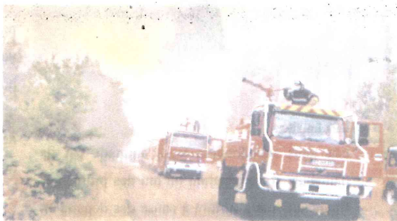
Illustration 1: Illustration 1: https://www.sudouest.fr/2015/07/25/incendie-a-saint-jean-d-illac-33-les-premieres-images-des-degats-2079422-5138.php

Ces gestes simples à prendre peuvent sauver les forêts, les animaux et sauver des vies! Les plus grands feux de forêts arrivent souvent en Californie (la Californie se situe aux Etats-Unis, au Sud Ouest du pays). C'est la sécherresse qui provoque la plupart des feux de forêts en été. Mais, 85% des incendis sont provoqués par l'Homme!